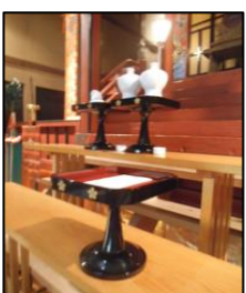
神前におあげした用紙

こちらの申込用紙に必要事項をご記入の上、初穂料千円と共に前日までに社務所までお持ちください。一校で試験日が複数ある場合は並べてご記入下さい。（住所、氏名は受験者ご自身です。）